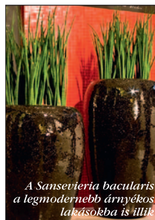
A Sansevieria bacularis a legmodernebb árnyékos lakásokba is illik

A Construma 33. Nemzetközi Építőipari szakkiállításon, áprilisban a Makeosz már a VI. Magyar Kertépítő Versenyt szervezi. Összeállt az elmúlt 5 év Magyar Kertépítő Versenyeinek munkáit, a verseny részleteit, tapasztalatait bemutató könyv anyaga. A szövetség a szakmából és a beszállítói körből együttműködő partnereket keres a kiadásához.