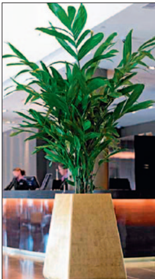
▲ Árnyékos szállodai terek szép növénye a Chamaedorea Metallica

A tudatos, tervszerű, a minőséget megőrző beavatkozások nélkül a gyeppel nem képes ellátni a feladatát.