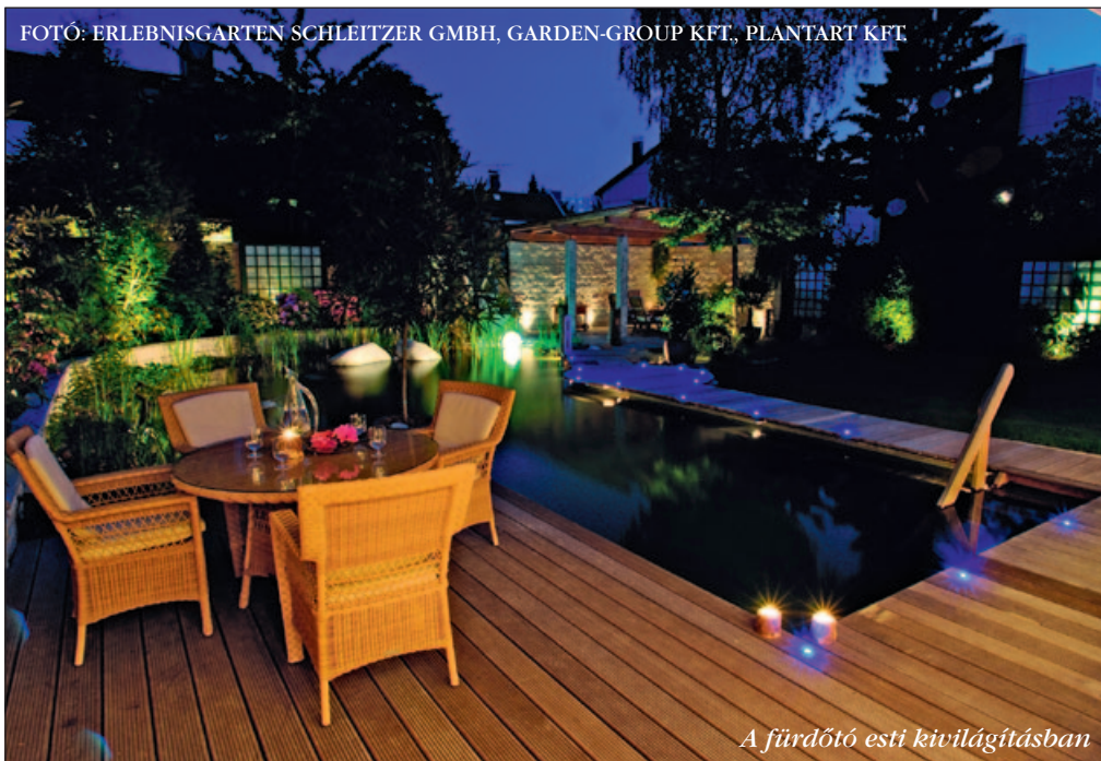
A fürdő téli kivilágításban

56%-os a részarányuk. Az ágazat résztvevői úgy látják, hogy a jövőben a közterületeken és az ipari területeken is növekvő árbevételre lehet számítani. Bízunk abban, hogy a városi zöldfelületek iránti igény arra ösztönzi majd a döntéshozókat, hogy támogassák a mind vonzóbban megalkotott zöldfelületek, parkok születését.