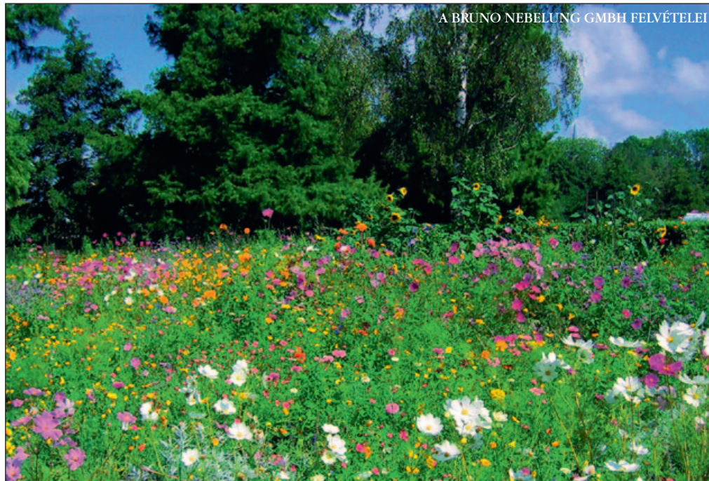
▲ Egynyári magkeverék, előtérben a sokszínű pillangóvirággal ( Cosmos )

Kaszálásra alig van szükség, alacsony a tápanyagigény és látványos a virágzás. További előny, hogy a vegetációs időben nincs szükség tápanyag kijuttatására. Sőt, a sok tápanyag megdőlést okozhat, és a gyorsabban fejlődő füvek elnyomják a vadvirágokat. Ha magas a talaj tápanyagtartalma, akkor a fel-