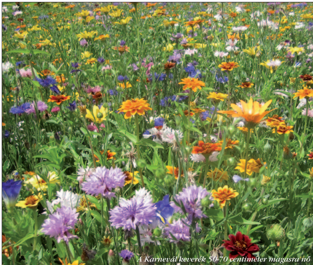
A Karnevál keverék 50-70 centiméter magásra nő

A cég az egyedi igényekre is figyel, kérésre különleges összetételű terméket is készítenek. Az évelőkeverékek közül forgalmazznak olyan összetételt, amely nitrogénnel gazdagítja a talajt. Az úgynevezett „bogárparadicsom” keverékek a biodiverzitás és a biológiai sokféleség miatt fontosak, sok rovarnak adnak élőhelyet. A biotop keverékek az építkezések után segítik a talajok regenerációját. Méhlegelőként használatos és zöldtetőre vethető keverékek egyik típusában a Sedum magok mellett 5%-ban gyógynövényeket is találunk, de csak Sedumot tartalmazó magkeverék is létezik zöldtetőre. A vadbújtató típus növényei olyan magasra nőnek, hogy a vadak könnyen találjanak bennük menedéket. Az évelővirág-keverékek az első évben a legszebbek. Ezt kö-