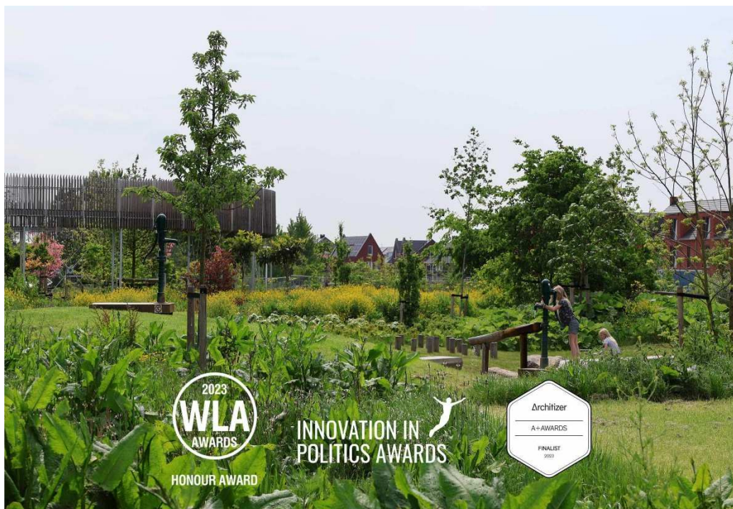
Képek: ehető park, Utrecht.

Az, hogy kell-e több zöld vagy sem, már nem kérdés. A városokban tudatosan tervezett és fenntartott zöldfelületek jelentős megnövelése nélkülözhetetlen a jelenben. Nincs már időnk. A kérdés az, hogyan.